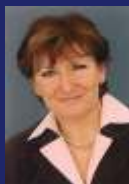
Irene Bach Kaufm. Hausverwaltung Tel. 0732/66026030